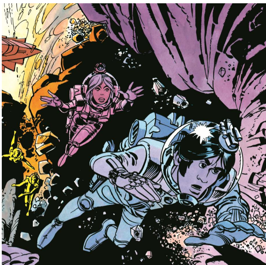
© Mézières / Christin / Dargaud