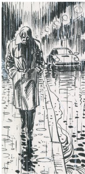
© Mézières / Christin / Dargaud

Le Centre des monuments nationaux propose, en partenariat avec Les Arts Frontières, les Éditions Dargaud, l'Office de tourisme du Pays de Gex, Delastre Films et Oblique Art Production, l'exposition « Mézières, étoile du 9 ème art » du 10 février au 23 juin 2024 au Château de Voltaire. Cette rétrospective présentera l'univers foisonnant du mythique dessinateur de Valérian et Laureline , Jean-Claude Mézières, à travers une incroyable collection de dessins et de planches originales issus des archives de l'auteur.