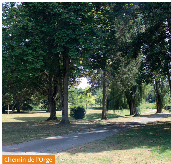
Chemin de l'Orge