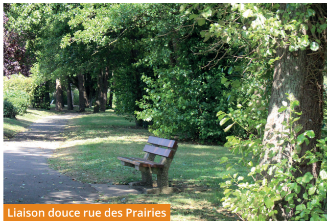
Liaison douce rue des Prairies

Au départ de la Mairie , emprunter la rue de la Boëlle Bizard en direction de la gare « Breuillet-Village ». Puis tourner à gauche sur la rue de la Gare en direction de la rue des Prairies , après le passage à niveau. Suivre la liaison douce jusqu'à la résidence de Port-Sud.