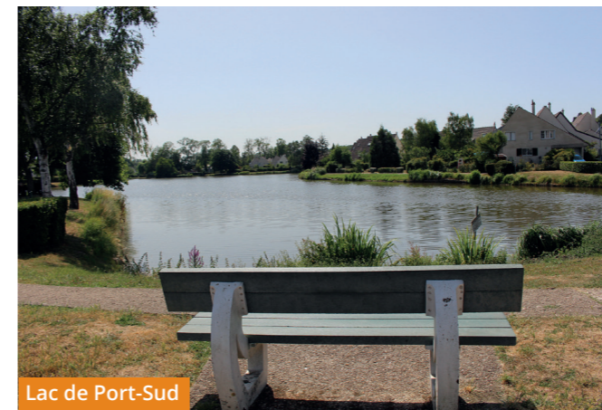
Lac de Port-Sud

Continuer à droite pour rallier l' avenue Surcouf . Devant le groupe scolaire Port-Sud, traverser le pont et tourner à gauche pour rejoindre la route d'Arpajon . Tourner à gauche en direction du passage à niveau, PN28, dit du « Bout du Monde ».