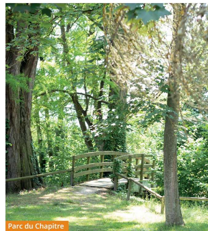
Parc du Chapitre