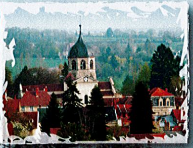
Église de Bellenaves