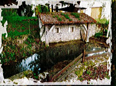
Lavoir de Crouzat