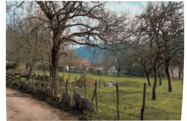
Le paysage grandiose de la Vallée de l'Ain abrite aussi une agriculture ancienne qui façonne les pentes faibles et les replats.