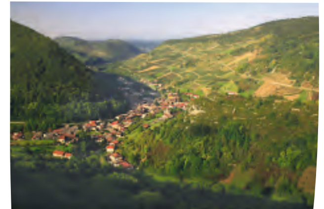
Le village de Cerdon au fond de sa reculée naturelle. Le vignoble s'étend sur les coteaux alentours, profitant d'une exposition ensoleillée.