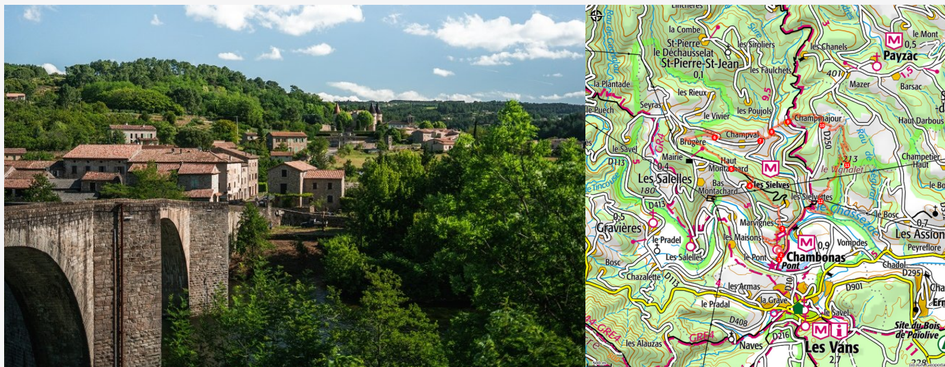
Le Pont, Chambonas

Cette boucle vous fera découvrir les hameaux de Chambonas entre vignes et châtaigniers.