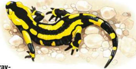
SALAMANDRE DESSIN P.R.