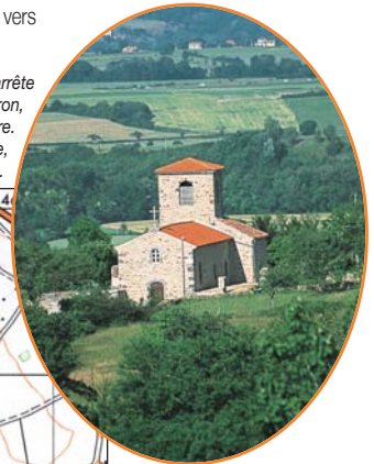
Et Marianne veille sur Saint-Géron...