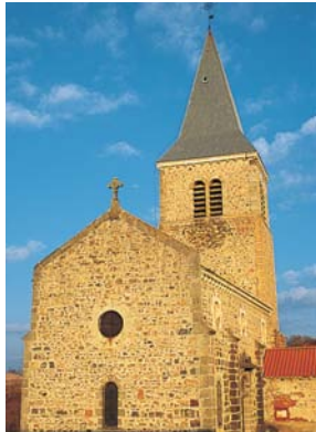
L'église romane de Saint-Beauzire.

Passé le maillage coloré des champs et des pâtures, la forêt s'empare du paysage, avec ses essences de feuillus et de résineux mêlés, abritant des grands cervidés. En fin de balade, le château de Lespinasse.