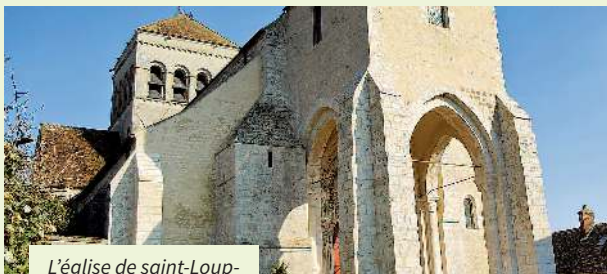
L'église de saint-Loup-de-Naud

Elle reçoit à Saint Loup le Tout Paris musical, littéraire et mondain jusqu'en 1968. Propriété privée classée monument historique, le site se visite lors des journées européennes du patrimoine.