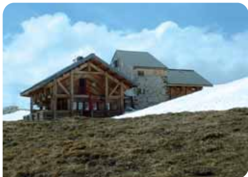
Refuge du Col de la Croix du Bonhomme

Redescendez au fond du glacier des Lanchettes, traversez au pied des Rochers Rouges, puis suivez les marquages de peinture... une bonne heure et fin du premier round !