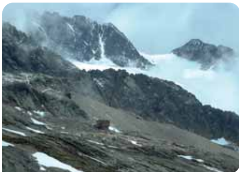
Refuge Robert Blanc depuis la Grande Écaille