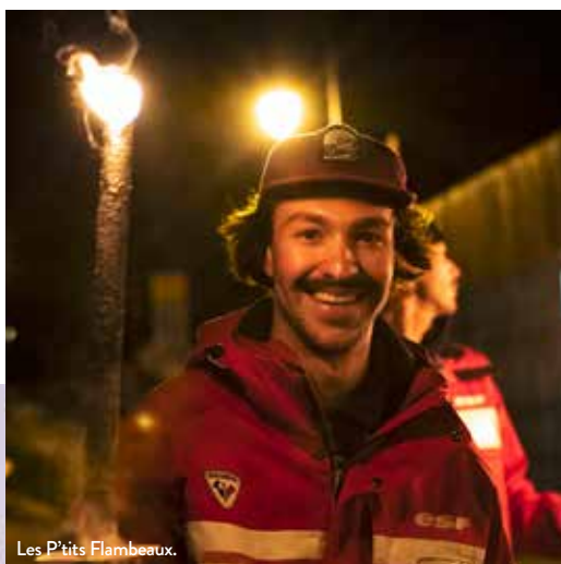
Les P'tits Flambeaux.

La montagne française se mobilise pour les enfants. Initié en 2024 par France Montagnes sous l'impulsion de ses 3 membres fondateurs : l'Association Nationale des Stations de Montagne, Domaines skiables de France et le Syndicat National des Moniteurs du Ski Français, cet événement solidaire national en montagne aura lieu le 25 février. Il a pour objectif de faire connaître la montagne en hiver aux plus jeunes. A l'instar des stations participantes, celle de Châtel organise, en simultané, une descente aux flambeaux (à acheter) avec les moniteurs ESF, ouverte au public. Les fonds sont reversés aux associations « Petits Princes », « Génération Montagne » et « Enfance et Montagne ».