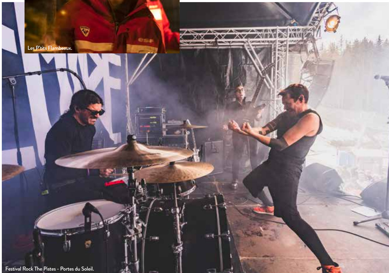
Festival Rock The Pistes - Portes du Soleil.