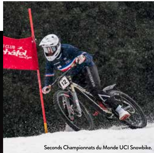
Seconds Championnats du Monde UCI Snowbike.