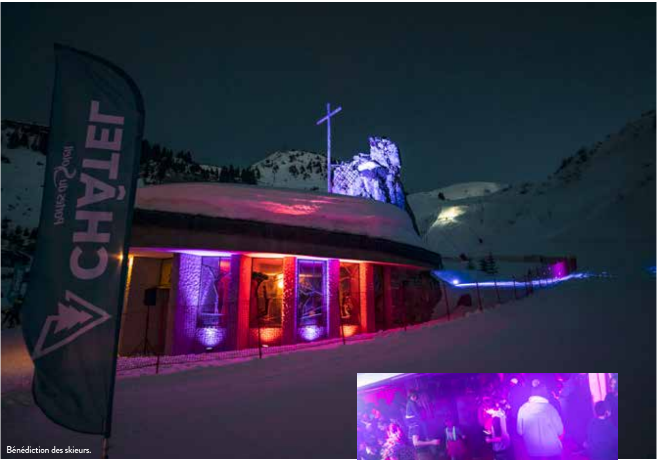
Bénédition des skieurs.