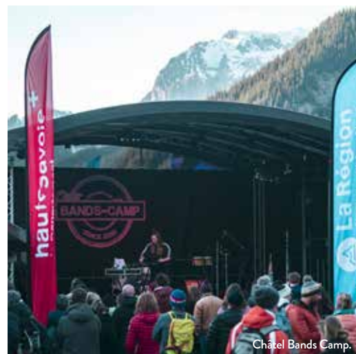
Châtel Bands Camp.