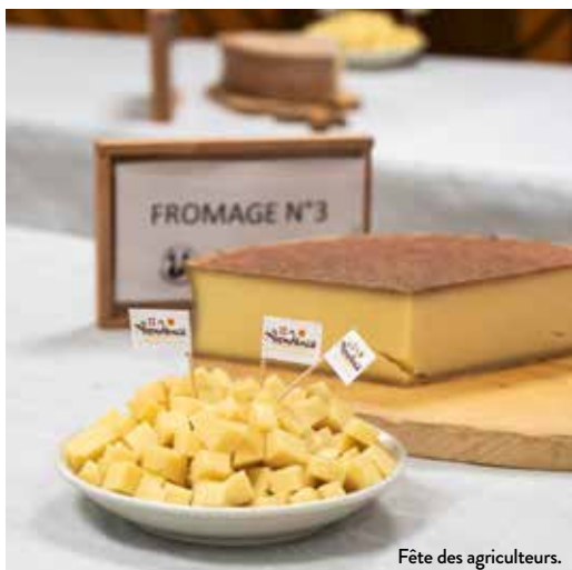
Fête des agriculteurs.