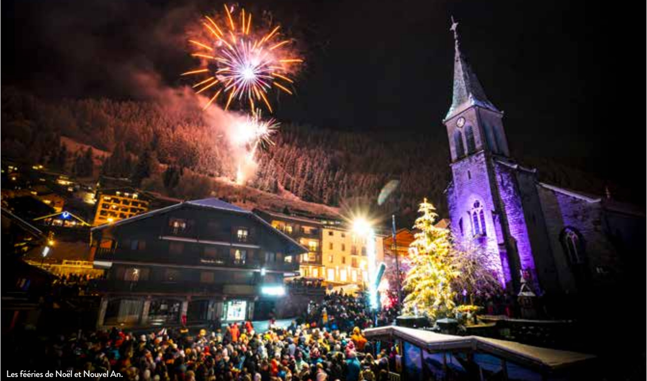
Les fêtes de Noël et Nouvel An.