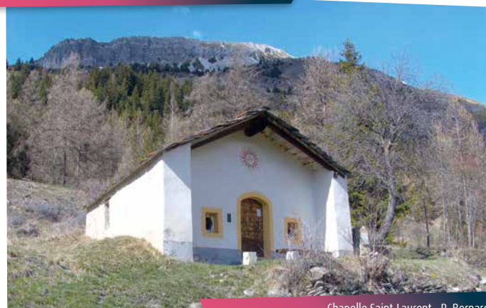
Chapelle Saint-Laurent - R. Bernard

Entendez-vous la cascade du Diet dans votre dos?