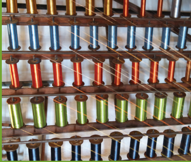
La passementerie à Saint-Just-Malmont

LA PÉTANQUE À LA SAINT-JUSTAIRE Le dimanche, jour de repos, munis d'une boule de bois d'acajou et d'un « quillou » ou « buis », les hommes de Saint-Just participent sur les chemins à quatre, cinq, six ou sept pour jouer « à la courte ». Le premier joueur tirait le buis, portait sa boule puis désignait le joueur suivant. Établi à l'amiable, le règlement autorisait à frapper sur la boule de l'adversaire ou à tirer sur le buis, et finit deux ou trois perdants. Chaque participant était pourvu d'une petite baguette, une corde étant faite avec le contenu sur celle des perdants. Malgré les conditions qui se formaient contre celui qui se détachait, la pétanque à la Saint-Justaire se terminait toujours autour d'un verre de famille.