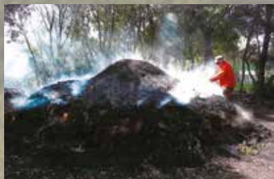
Construction d'une charbonnière