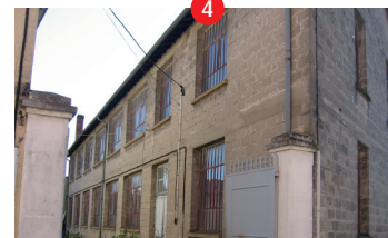
Ancien atelier Duffey