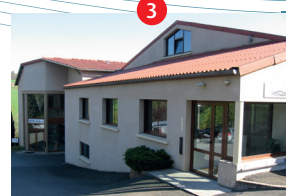
Entreprise Denis & Fils