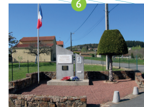
Monument du Crêt