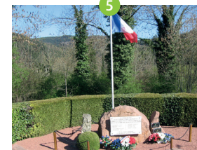
Monument du Magat