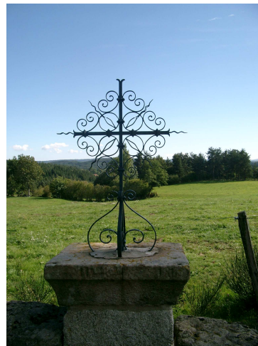
Croix à La Fayolle

Circuit familial : 5,5 Km 2h00 (Raccourci 4.4 km)