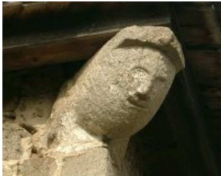
Corbeaux à la Rivoire