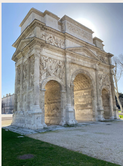
Arc de Triomphe d'Orange