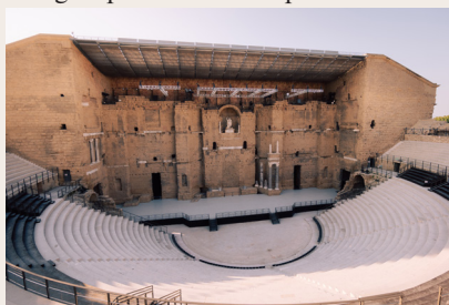
Théâtre antique d'Orange

et sa programmation culturelle annuelle font d'Orange, une ville incontournable de la Provence avec un théâtre antique toujours utilisé et réputé qui accueille des groupes musicaux réputés.