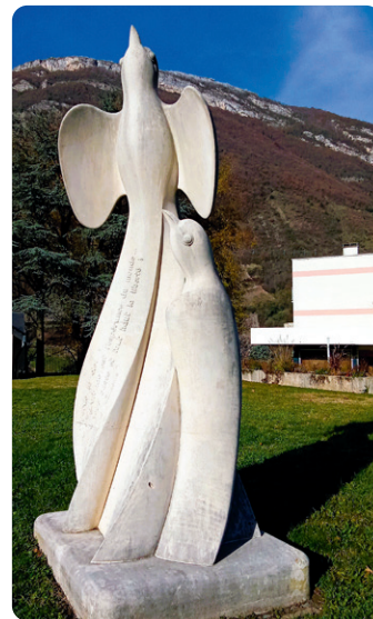
PLACE ALBERT SERRAZ

Montmélian, est placée au carrefour de la Combe de Savoie, du Grésivaudan et de la Cluse de Chambéry. Déjà à l'époque antique, la voie romaine longeait les coteaux le long de la rivière Isère et passait à hauteur de Montmélian en direction de Lemencum (Chambéry). Le croisement des voies de communication explique son implantation et le développement très ancien d'une place fortifiée. Avec un emplacement aussi stratégique, elle subit plusieurs sièges savoyards, français, espagnols. La cité au pied du fort est enserrée dans ses remparts du moyen âge. Une visite s'impose.