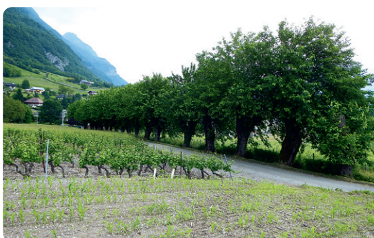
LE CHEMIN DES MÛRIERS