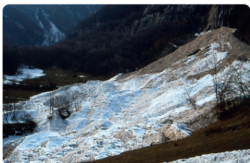
NÉVÉ DE PLAN CRUET