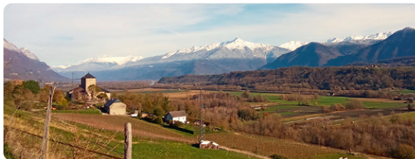
LE DOMAINE DU CHÂTEAU DE LA RIVE AVEC AU FOND LE GRAND ARC (2484 M)

Continuer sur D201 au hameau la Baraterie.