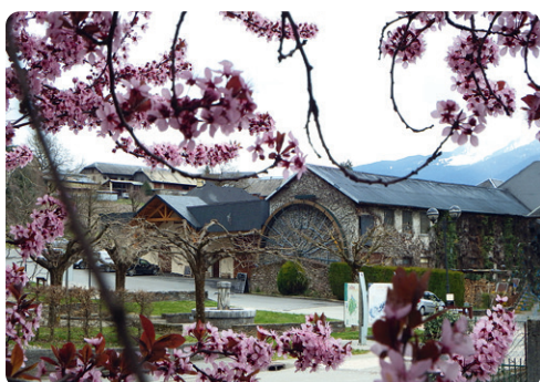
LA GRANDE ROUE