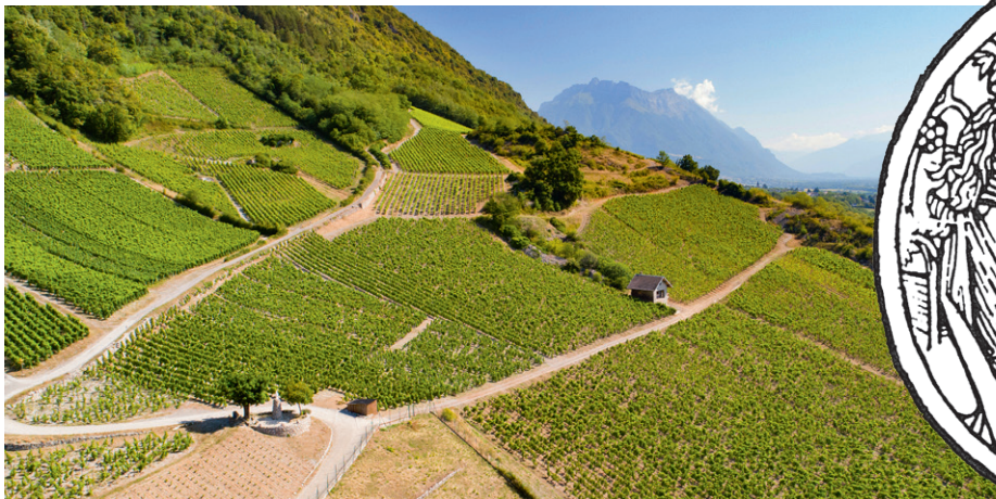
LE VIGNOBLE D'ARBIN

Ici, la vigne produit très bien et depuis très longtemps. Des auteurs tels que Pline et Columelle en font déjà état au 1 er siècle avant J.C. Depuis et jusqu'à notre époque contemporaine, ce fut la création puis, après les ravages du phylloxéra, la renaissance du vignoble savoyard par la mise en valeur des procédés de culture, la quête de la qualité. Ce terroir historique est donc un espace représentant la conjonction d'un sol, d'un climat donnant ainsi un caractère unique au raisin récolté et aussi du travail des vignerons gardiens du temple.