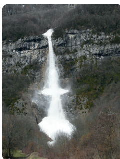
AVALANCHE DE PLAN CRUET