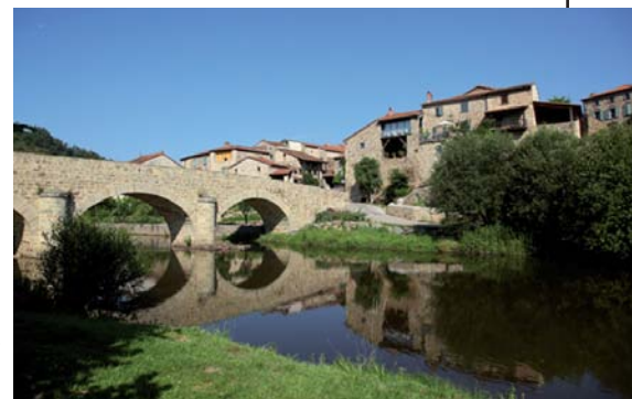
Le pont de Lavaudieu qui enjambe la Senouire.

haies. Descendre sur une petite route. 5 Prendre à gauche un chemin peu marqué. Il monte et sinue entre bois et prairies. À l'intersection, emprunter à droite un sentier en sous-bois ( vue sur Lavaudieu ). Rejoindre la route qui descend à Lavaudieu. Sur la place, face au cloître , descendre dans les ruelles à droite jusqu'au pont ( point de vue sur Lavaudieu, hors circuit en traversant le pont ), puis à gauche vers le parking.