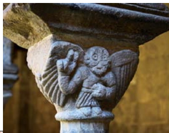
Chapiteau à Lavaudieu.

De Lavaudieu, le chemin file vers Billanges entre bois et prairies. Puis il gagne la colline de la Garde, où fut bénie la croix du même nom, devenue la cru di fio, avant de revenir par les collines du « bois Mavin », naguère couvertes des vignes de « Madame ».