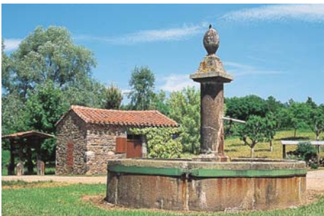
Le couderc de Billanges et, en haut, le busard cendré, rapace gris pâle à la pointe des ailes noire.

Survolant la plaine céréalière de Fontannes, le busard cendré, « prince des blés », vous accompagnera peut-être jusqu'au couderc de Billanges... Au retour, vous passerez près de la fontaine ou saint Eutrope se désaltéra en se rendant à Saint-Jacques de Compostelle.