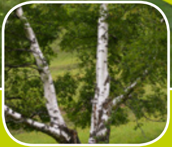
Un mariage de raison