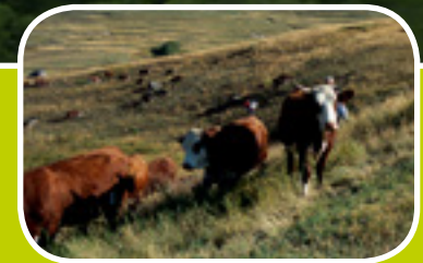
Terre d'accueil pour les troupeaux

Durée : 3 h Parcours facile Dénivellation : 200 m