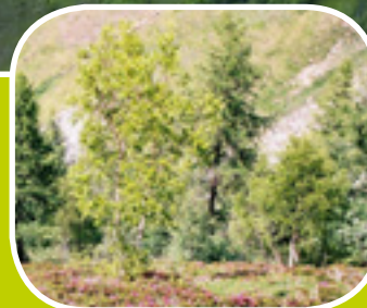
La forêt disparue