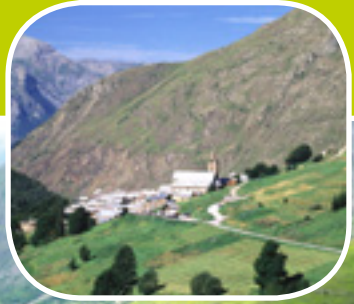
A la rencontre des Bessats