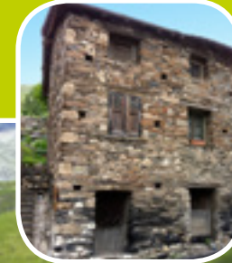
Architecture sans fioriture