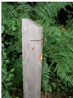
Poste de contrôle

Le but est d'aller d'un poste à l'autre en construisant son itinéraire.