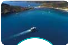
LES 3 CAPS CAMARAT, TAILLAT, LARDIER