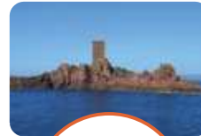
LES CALANQUES DE L'ESTÉREL