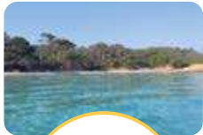
ÎLES PORQUEROLLES PORT-CROS