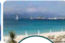
CANNES ÎLE STE MARGUERITE