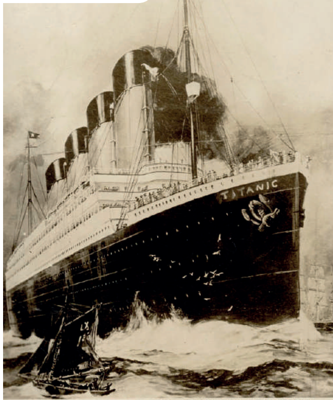
THE ILL-FATED S. S. TITANIC, FOUNDERED APRIL 15, 1912.