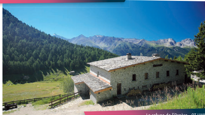
Le refuge de l'Orgère

À votre retour, arpentez les ruelles de Villarodin et du Bourget pour dénicher quelques secrets de patrimoine.