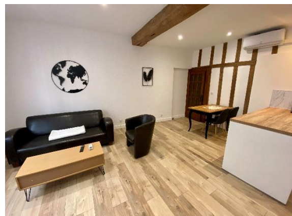
Coin salon confortable