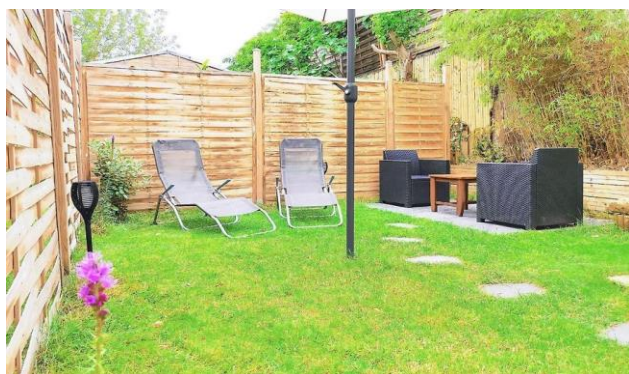
Jardin privatif pour profiter de l'extérieur au calme