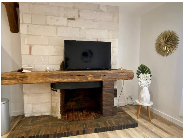
Grande télévision avec belle cheminée