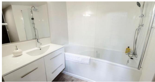
Salle de bain avec baignoire