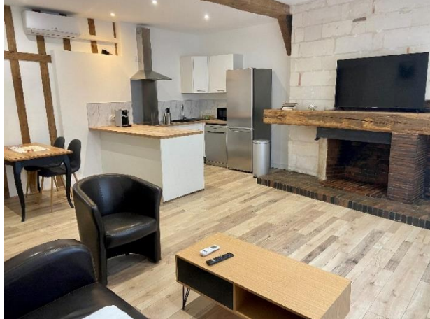
Salon cuisine spacieux