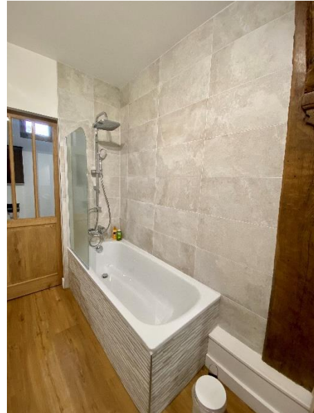
Salle de bain moderne