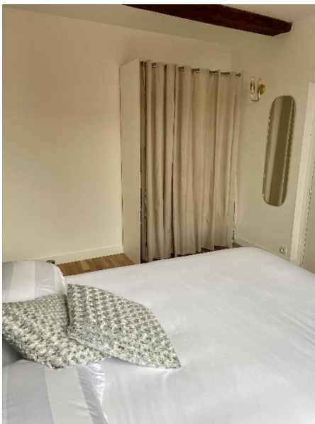
Dressing et miroir