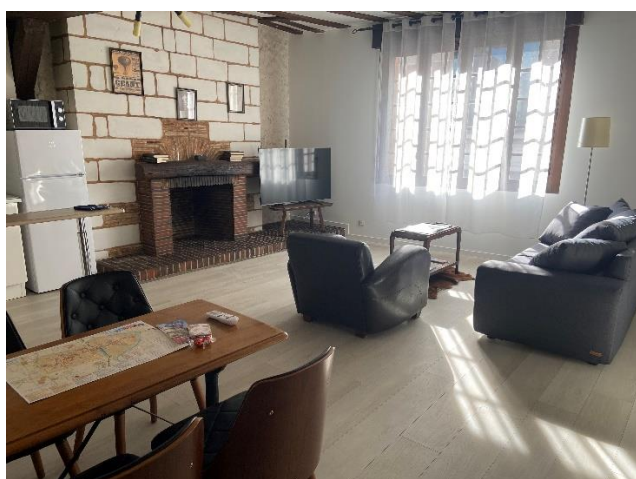
Salon avec canapé Poltronsofa convertible