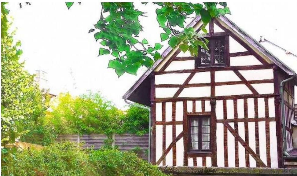
Belle maisonnette indépendante à colombage

Capacité maximum du logement 2 personnes et un bébé