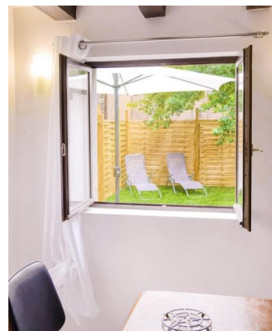
Vue de la cuisine