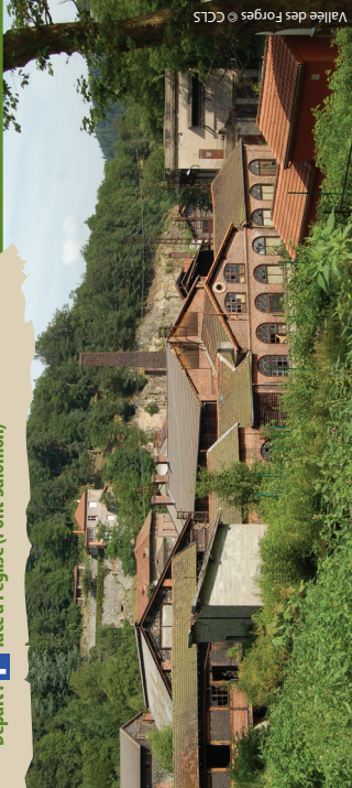
Vallée des Forges

Départ : P face à l'église (Pont-Salomon)