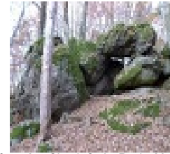
Légende : Circuit C : La Roche Mathiole

Balisage : lettre du circuit sur fond bleu. Départ place du Plon. Ce parcours vous conduira vers un amas de rochers caractéristiques de notre région. Vous découvrirez le Village Vacances et son plan d'eau. De Maintigneux, vue sur les Monts du Forez.