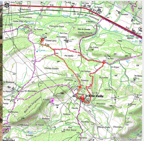
Depuis la Vieille Tour, La Bâtie-Vieille (Alain Hugues)

Entre nature et patrimoine, une promenade paisible à la découverte des curiosités historiques de La Bâtie-Vieille