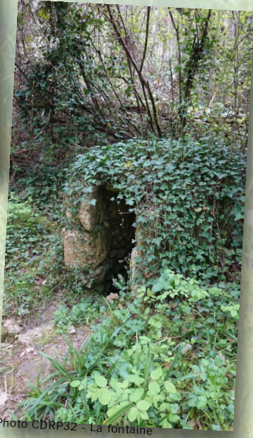
La fontaine

Cette forêt est un merveilleux livre sur la vie sauvage. Profitez des différents parcours qui offrent des points de vue remarquables et partez à la découverte de la fontaine dissimulée au cœur du massif ou faites une pause au refuge.