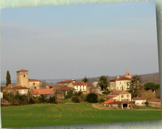
Photo CDT32 - Cazaux d'Angles