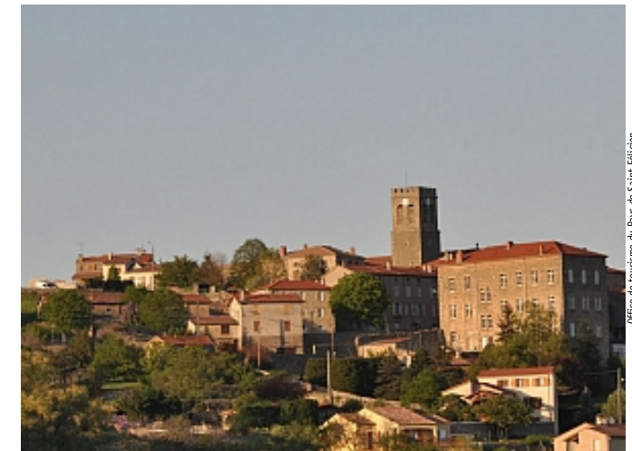
Office de tourisme du Pays de Saint-Félicien