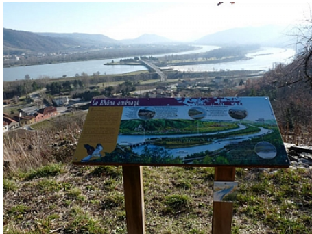
Table d'orientation de la Tour d'Arras

Apprenez à regarder et comprendre le paysage qui s'offre à vous: le Rhône, les terrasses de St Joseph... Un sentier pédestre accessible à tous vous y conduit.