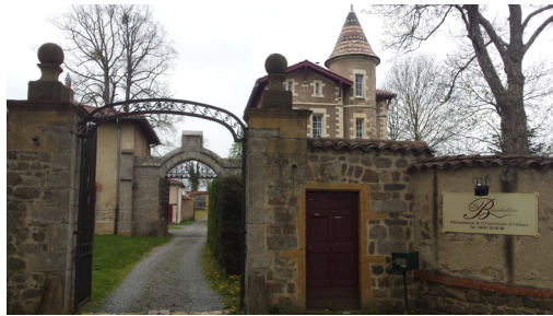
Entrée du château de la Bourdelière