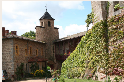
Le château de Chamousset

La Maison de la Mine, au bourg de Brussieu, vous parle de la vie des mineurs et vous propose une belle collection d'outils et minerais (04 74 70 90 64)