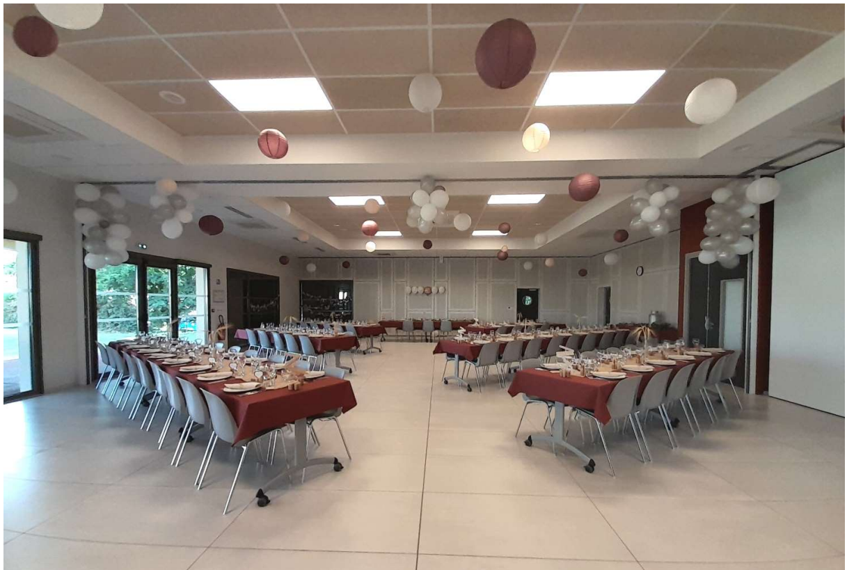
EXEMPLE AMENAGEMENT DECORATION GRAND ESPACE RENCONTRE

Un escabeau est mis à disposition, rangé dans le local ménage.