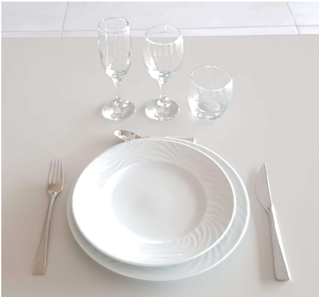
SERVICE DE VAISSELLE