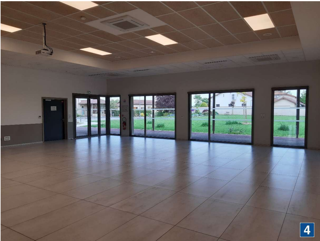
PETIT ESPACE RENCONTRE