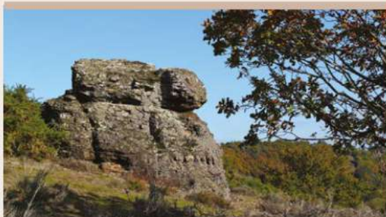
LE MÉGALITHE DE PÉRACLOS

Les cupules au sommet de la table, les marches d'accès de la face nord et les profils grossiers de chiens de la face sud – comme surveillant la vallée aux points cardinaux – sont autant d'éléments qui semblent confirmer le caractère mégalithique.