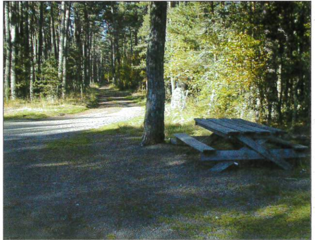
Table de pique-nique entre Lacombe et Verniols, une halte s'impose !

De petit animal à cornes en forme de lyre, bondissant à travers les pins sylvestres et les genêts, vous ne verrez point. Pas plus que de créatures faisant leurs séances d'aérobic, arborant leur body moulant à l'effort de leur club "les gazelles". Dans la région, on retrouve plusieurs lieux portant ce nom. En patois local "gazer" signifie "traverser", un ru, une rivière, une vallée ou bien maintenant un barrage.