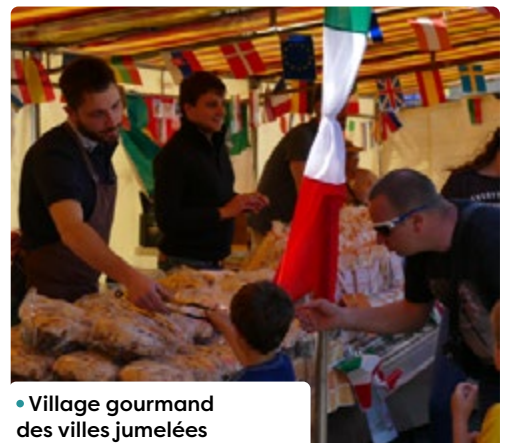
• Village gourmand des villes jumelées