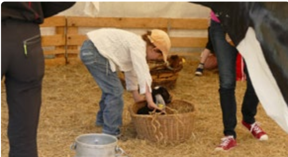
• La mini-ferme permet aux enfants de découvrir animaux et gestes traditionnels (ci-dessous simulateur de traite).