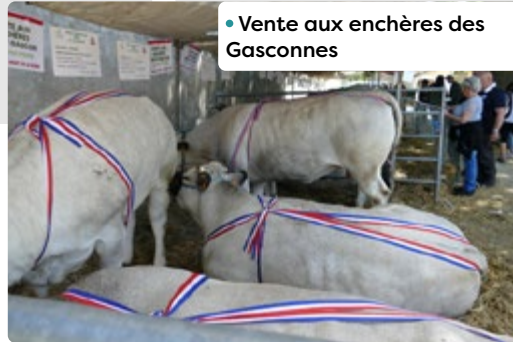
• Vente aux enchères des Gasconnes