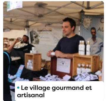
• Le village gourmand et artisanal