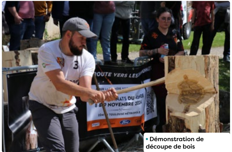
• Démonstration de découpe de bois