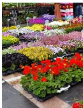
• Les Floralies