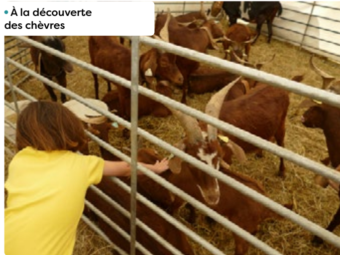
• À la découverte des chèvres