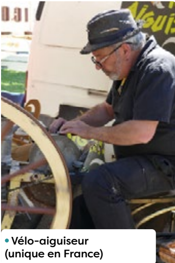
• Vélo-aigiseur (unique en France)