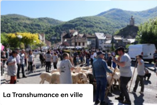
• La Transhumance en ville