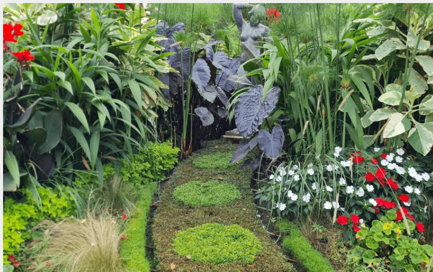
Albi Parc Rohegude (Albi Tourisme)