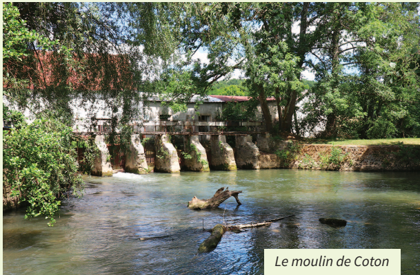
Le moulin de Coton

A Sablonnières, les voyageurs pouvaient prendre une correspondance pour Rebaix, Saint-Siméon, voire Nangis ou Bray-sur-Seine.