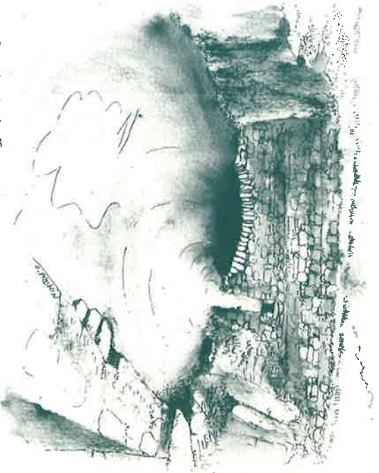
Bassin de la Jasse

Là, on rejoint le GR 61 sur un beau sentier ombragé, très agréable. Prendre la direction de "La Rouvière" après avoir traversé plusieurs gués de ruisseaux, grimper le chemin dans de la roche pour trouver le croisement de "La Rouvière". Quitter le sentier pour cheminer et serpenter à droite au dessus d'un ruisseau en contrebas.