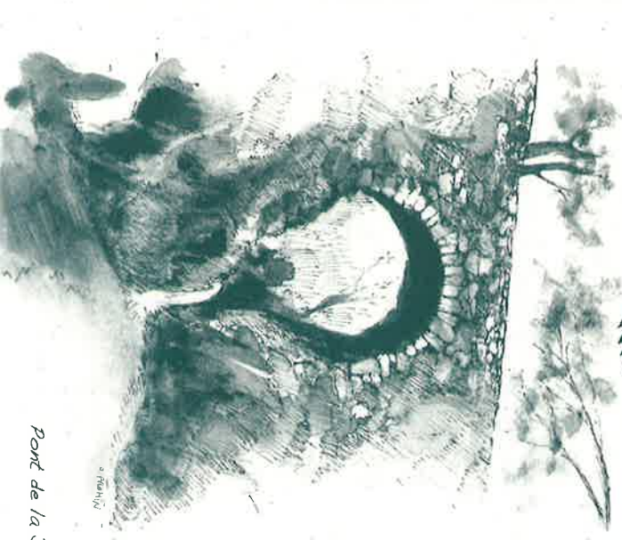
Pont de la Jasse

▲ Avant de changer d'orientation, une superbe vue sur le massif de l'Alagnol se profile à l'horizon entre des cîhènes puis virer coté vallée obscure avec sur le versant en face le profil du sentier de la diligence qui monte vers le col du Briontet