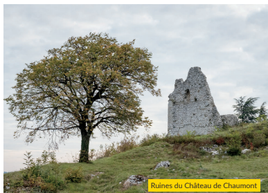
Ruines du Château de Chaumont