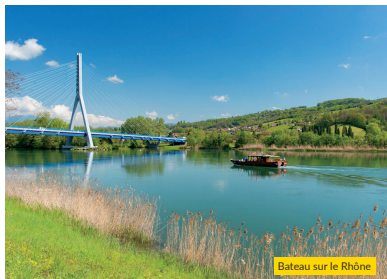
Bateau sur le Rhône