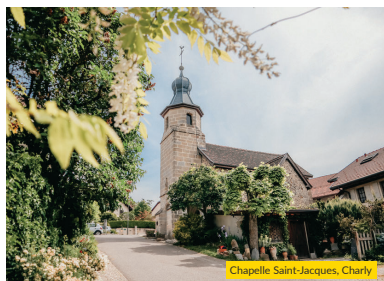
Chapelle Saint-Jacques, Charly