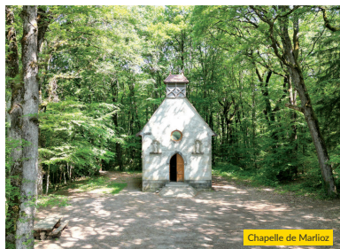
Chapelle de Marlioz