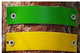
Vous êtes sur le bon chemin