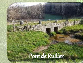
Pont de Ruiller