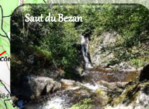
Saut du Bezan