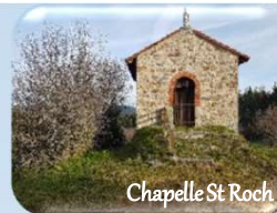
Chapelle St Roch