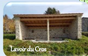
Lavoir du Cros