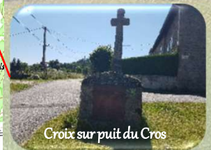
Croix sur puit du Cros