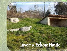
Lavoir d'Eclune Haute