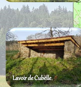
Lavoir de Cubelle