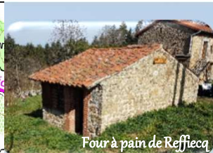
Four à pain de Reffiecq