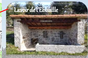
Lavoir de l'Ebisaille