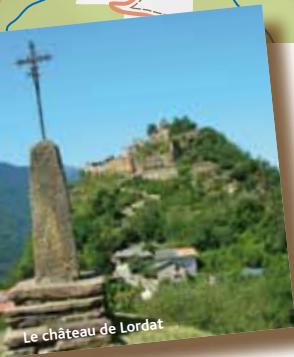
Le château de Lordat