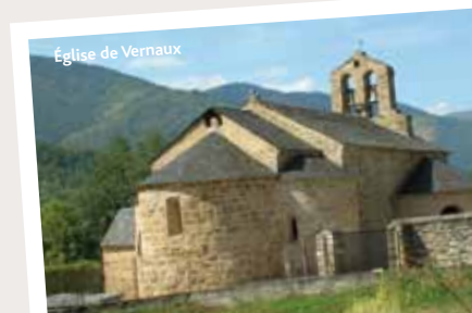
Église de Vernaux

L'église Sainte-Marthe, à mi-chemin entre Vernaux et Garanou, date de la fin du XI e siècle. Elle est construite en tuf (roche poreuse légère formée de concrétions calcaires déposées dans les sources). Son plan présente une nef à vaisseau unique ouverte sur une abside et deux absidioles disposées perpendiculairement qui donnent au chevet une forme triflée. Classée monument historique en 1910, la toiture a été abaissée en 1966 afin de lui rendre son allure d'origine.