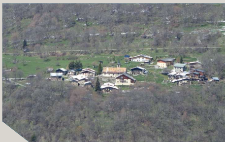
Le hameau de l'Eglise à Montdenis

8 L'Eglise - Arrivé au hameau de l'Eglise, traverser la route vers l'église, puis marcher encore quelques mètres derrière le bâtiment pour poursuivre sur un sentier vers le village.