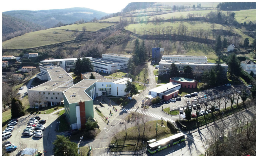
L'IUT de Saint-Etienne et son éco-campus (jardin partagé, éco-pâturage avec des moutons, etc.)