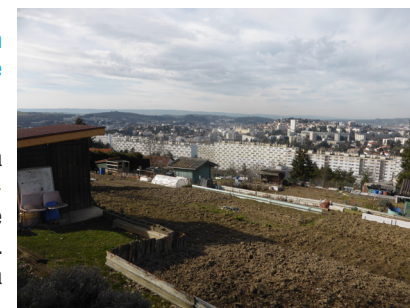
Depuis les jardins Volpette de la Métare