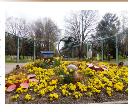
Entrée principale du parc de l'Europe

6 À l'entrée du cimetière, descendre à droite les escaliers et l'allée pour rejoindre la rue Frédéric-Bait. Descendre cette rue à droite jusqu'au bassin de Janon. Emprunter le passage piéton et longer le bassin. Pour rejoindre Terrenoire, continuer la rue Frédéric-Bait, puis en face l'avenue du Pilat. Vers l'église de Terrenoire, monter les escaliers et emprunter l'aménagement piéton pour passer entre l'église et la salle Jacques-Brel. Prendre à droite l'impasse Gérard-Thivollet et longer à gauche la place Jean-et-Hippolyte-Vial. 7