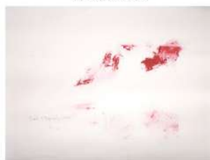
Dessin à partir du géant de St Dogmaels