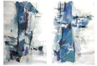
INVERSO - 1

daniel.mohen@bbox.fr www.daniel.mohen.free.fr