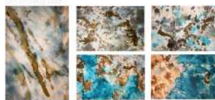
Détails de soies peintes.

Reliances & généalogies, magnification, apaisement, résilience aussi.