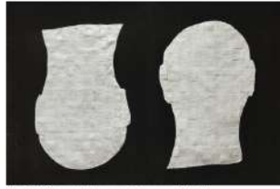
Les Entêtées, techniques mixtes sur géotextile.

chrisropert@gmail.com instagram : chrisropert loindanglesdroits.blogspot.fr