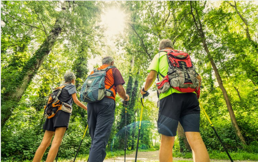
balade pédestre familiale sur l'islon saint luc, à Châteauneuf du Pape.