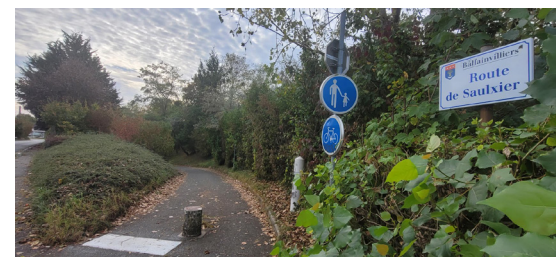
La route de Saulx à Ballainvilliers