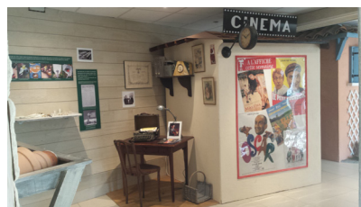
La Maison de la Rose 8