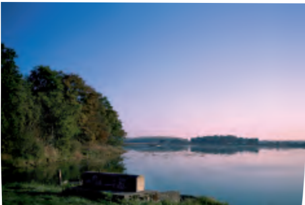
L'étang de Birieux est le plus grand de la Dombes.

En dehors des étangs, ce qui frappe le visiteur de la Dombes, ce sont les châteaux de briques rouges et les grands domaines terriens... Autant de témoins d'une époque où la Dombes était une principauté indépendante fondée en 1402 par Louis de Bourbon.