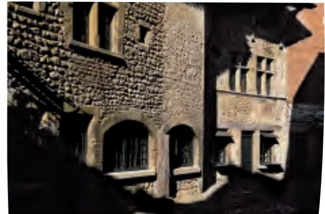
Cité médiévale de Pérourges.