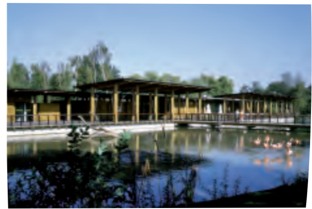
Le Parc des Oiseaux à Villars-les-Dombes reçoit près de 300 000 visiteurs chaque année pour une immersion grandeur nature dans le monde des oiseaux. A ne pas manquer : le spectacle d'oiseaux en vol !