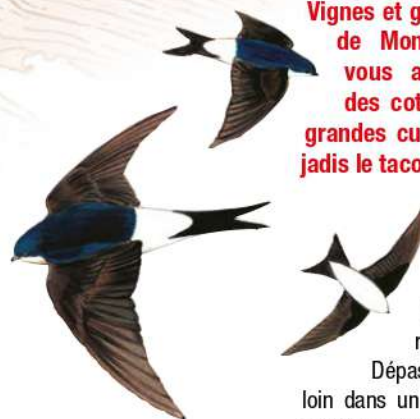
HIRONDELLES DES FENÊTRES / DESSIN P.R.

Vignes et grandes demeures (château de Montfand, manoir de Serre) vous attendent sur la hauteur des coteaux de Louchy. Ici, entre grandes cultures et vignoble, passait jadis le tacot.