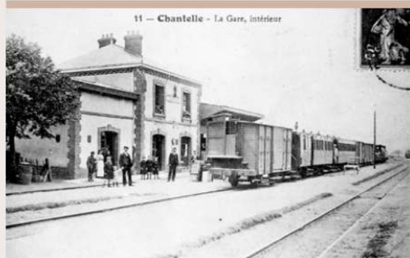
LE TACOT À LA GARE DE CHANTELLE

été reconverties en chemins ruraux. Ainsi, au gré des promenades champêtres, le légendaire « tacot » peut encore voyager dans les mémoires.