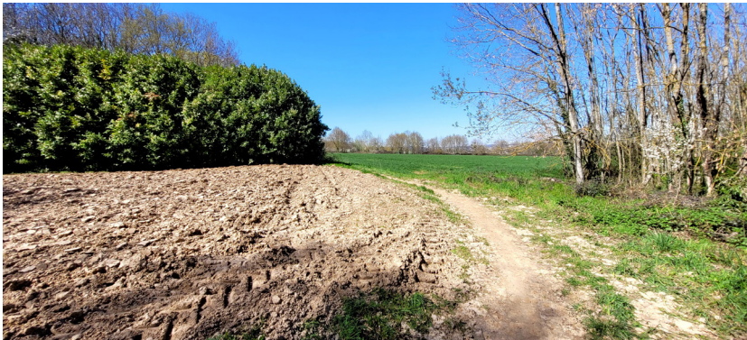
Cultures maraîchères à Villebon