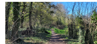
Le Bois du Rocher