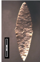
Dolmen 10 du Pech, poignard en silex

Vers 2 500 ans avant notre ère, les habitants des environs de Bruniquel ont bâti une